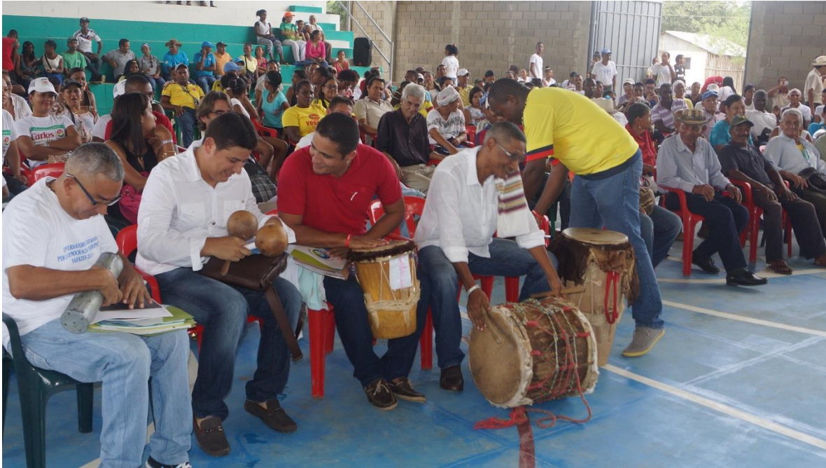
✓ Encuentro intergeneracional sobre música y danza tradicional