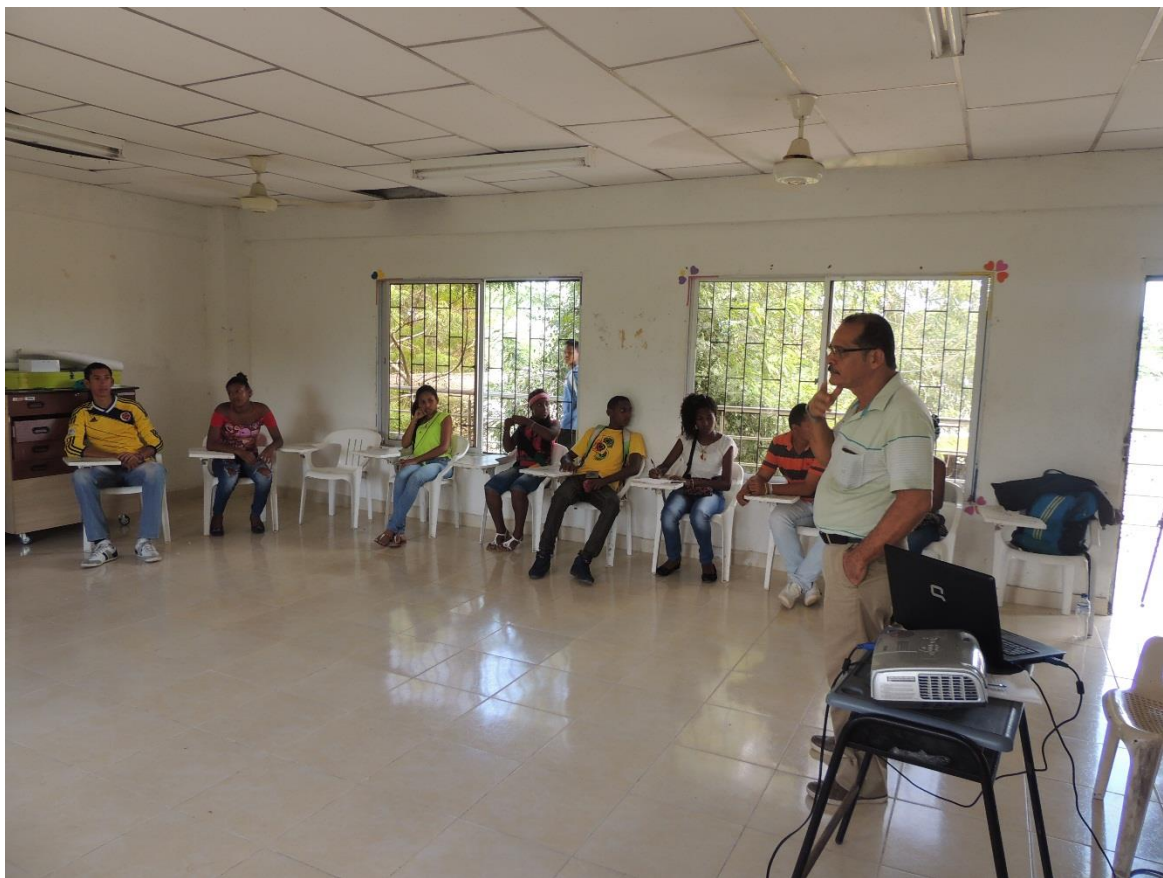
✓ Entrevistas con mayores de la comunidad