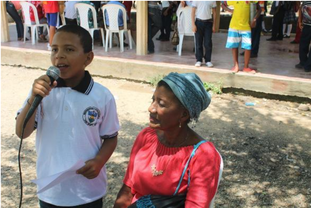
✓ Producción musical a tres voces